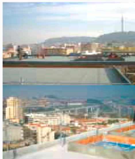
El Corte Inglés - Porto