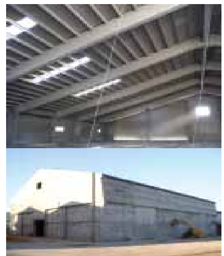
Sapec - CNE - Setúbal

Construtora: Montiterrras, SA Aplicador: Bloco