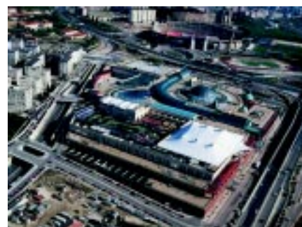
Centro Comercial Colombo