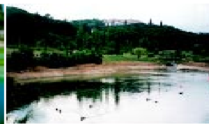
Lagoa da Quinta Patino