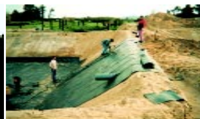
Lagoa de Tratamento - Instalação Agro Pecuária

ma simples e eficaz a retenção da água nessas estruturas.